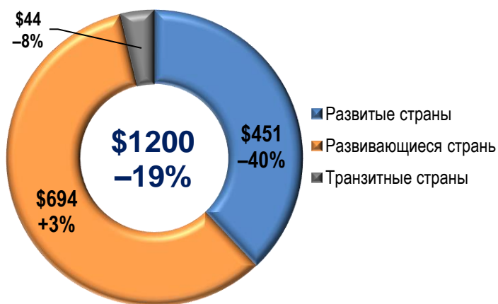
Распределение объемов притока ПИИ по группам стран в 2018 г. (млрд $)