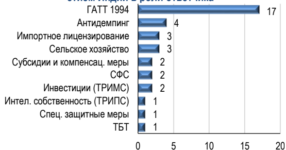
Тематика (по соглашениям ВТО) торговых споров с участием Индии в роли ответчика

Примечание: одно соглашение может охватывать несколько споров; из 24 споров выделены 18 «чистых» спорных ситуаций.