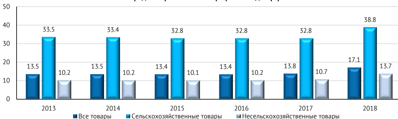
Средний применяемый тариф РНБ Индии (%)

Помимо дополнительных защитных мер, Индия потребовала изменить период, который принимался бы за базу при исчислении последующего снижения тарифов. Так как переговоры по ВРЭП были начаты в 2013 г., то в качестве такого периода был изначально предложен 2014 год. Между тем, в последние несколько лет средний уровень тарифной защиты в Индии возрос. По данным ВТО, средний применяемый тариф РНБ вырос с 13,5% в 2014 г. до 17,1% в 2018 г., что делало для Индии невыгодным использование в качестве расчетной базы более раннего периода. Однако по имеющейся информации , данное требование не получило поддержки со стороны других участников переговоров.